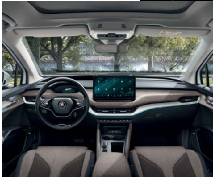
עיצוב פנים Lodge