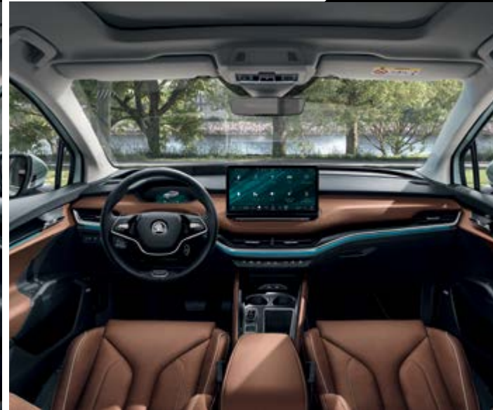
עיצוב פנים Eco Suite