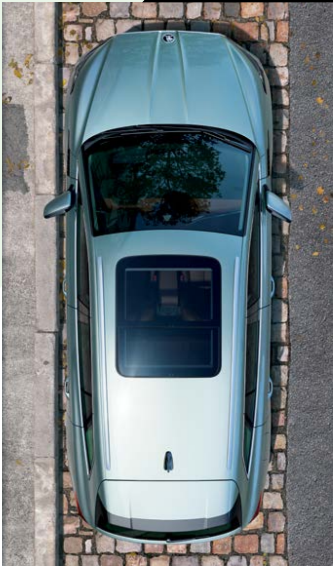
נג שמש פנורמי עם פתיחה חשמלית