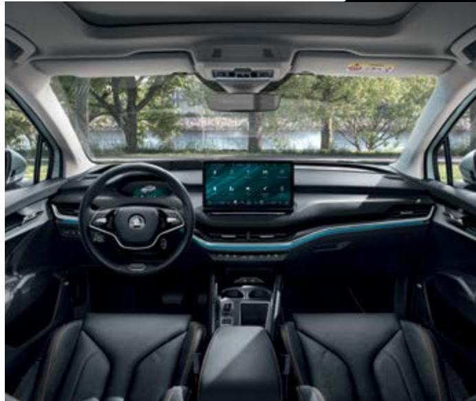
עיצוב פנים Suite