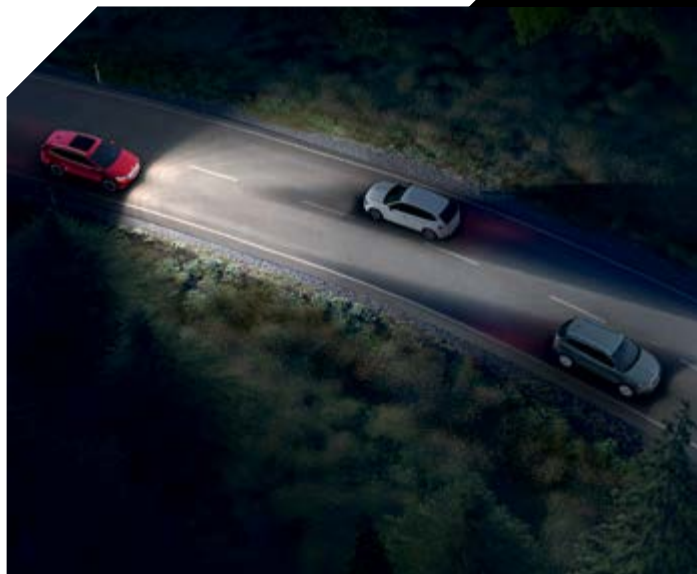
פנסי MATRIX BEAM