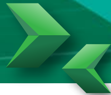
עיצוב פנים Loft