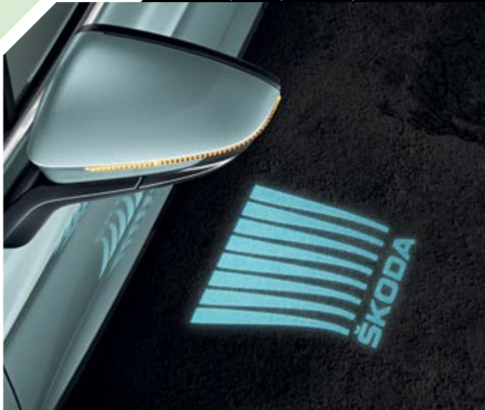
תאורת אווירה עם הקרנת לוגו סקודה מחוץ לרכב